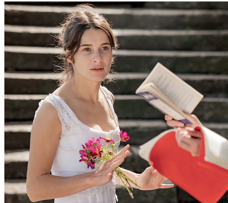
Une jeune fille qui va bien

«I 19 anni sono quell’età in cui tutto è possibile – racconta Kiberlain – e per me è il periodo della rinascita perché a quell’età mi sono scoperta attrice. Irène/Rebecca racchiude quel moto continuo, quella forza vitale. I 19 anni sono la mia età preferita: è stato allora che ho scoperto i film che amo. Mi proiettavo nell’insolente protagonista di Sandrine Bonnaire in À nos amours di Maurice Pialat. Ho sempre voluto catturare quel momento in cui si esce dall’adolescenza e si diventa giovani adulti, perché è un’età significativa, piena di tutto: il desiderio, la voglia di uscire di casa, la paura di abbandonare l’infanzia e la scoperta della persona che diventeremo». Una ragazza radiosa che debuttando alla regia, a 54 anni, ha trovato un modo per ricominciare e per rimettere in discussione la sua lunga carriera. Con le sue parole, dopo aver usato per tanti anni quelle altrui.